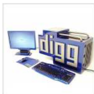
Моддинг в стиле Digg