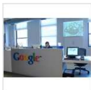
Офис Google в Нью-Йорке