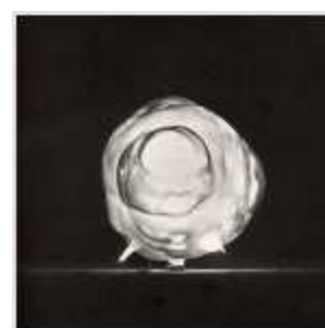
Атомный взрыв – первые микросекунды