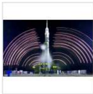
Ракета на старте