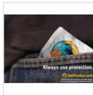
Firefox защищает Все фотоматериалы

добавить в избранное | копирайтинг | реклама | контакты