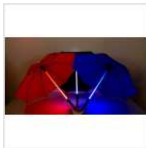
Зонтик для джедая